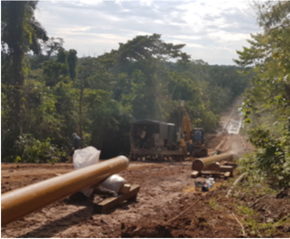
Ilustración 1: TUBERÍA DE CONEXIÓN DE PLATAFORMAS - 2KM APROXIMADAMENTE

Comunidad Paz y Bien, Sucumbíos 23 de octubre de 2017.