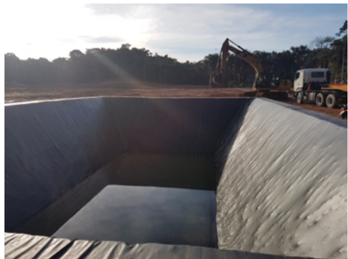
Ilustración 5: PISCINA PARA DESECHOS. 9 METROS DE PROFUNDIDAD POR 30 X 40 mts DE DIÁMETRO APROXIMADAMENTE