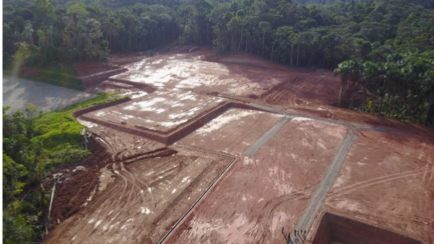
Ilustración 3: ÁREA INTEGRAL DE CONSTRUCCIÓN - 5 HECTÁREAS APROXIMADAMENTE

Desde los inicios de las obras los moradores de la comunidad han puesto en conocimiento de diversas autoridades (MAE, PREFECTURA, GOBERNACIÓN, AGENCIA DE HIDROCARBUROS) estos hechos sin que a la fecha se hayan tomado acciones de protección eficaces de ninguna índole; por ello desde la segunda semana de octubre han iniciado una medida de hecho que busca paralizar las obras que desarrolla ANDES hasta que al menos se desarrolle el proceso de participación social y socialización del Estudio de Impacto Ambiental.