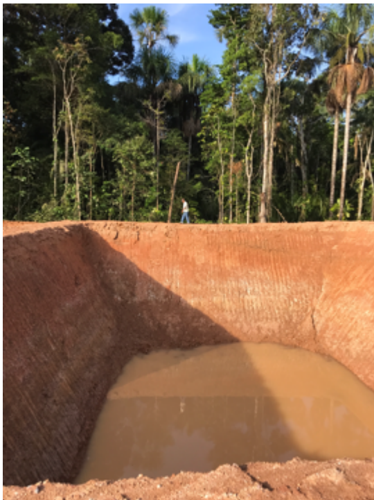
Ilustración 4: PISCINA PARA DESECHOS. 9 METROS DE PROFUNDIDAD POR 30 X 40 mts DE DIÁMETRO APROXIMADAMENTE

Desde los inicios de las obras los moradores de la comunidad han puesto en conocimiento de diversas autoridades (MAE, PREFECTURA, GOBERNACIÓN, AGENCIA DE HIDROCARBUROS) estos hechos sin que a la fecha se hayan tomado acciones de protección eficaces de ninguna índole; por ello desde la segunda semana de octubre han iniciado una medida de hecho que busca paralizar las obras que desarrolla ANDES hasta que al menos se desarrolle el proceso de participación social y socialización del Estudio de Impacto Ambiental.